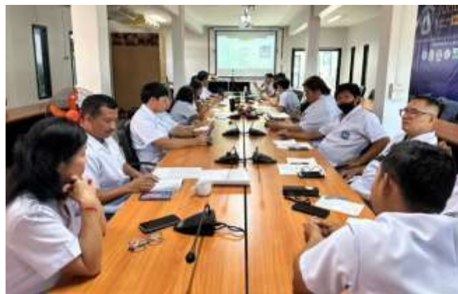
ภาพแสดงการประชุม ในวันจันทร์ ที่ 28 สิงหาคม 2566 (เพื่อระดมความคิดเห็นแก้ไขปัญหาที่พบ เมื่อปรับปรุงกระบวนการแล้ว)