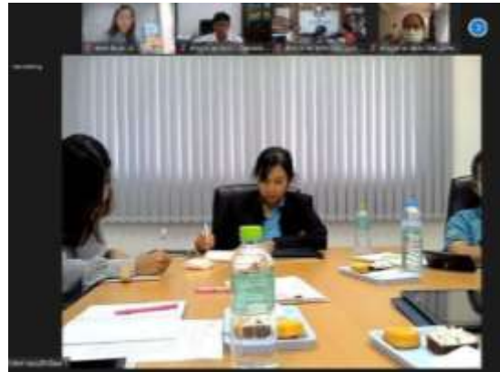
ภาพแสดงการเข้าร่วมประชุมคณะกรรมการขับเคลื่อนแผนงาน/โครงการ ภายใต้แผนพัฒนาจังหวัด/กลุ่มจังหวัด/องค์กรส่วนท้องถิ่นระดับเขต ผ่าน Zoom meeting ครั้งที่ 2/2566 ในวันพุธที่ 12 กรกฎาคม 2566 (เพื่อประชาสัมพันธ์การปรับเปลี่ยนกระบวนการ)