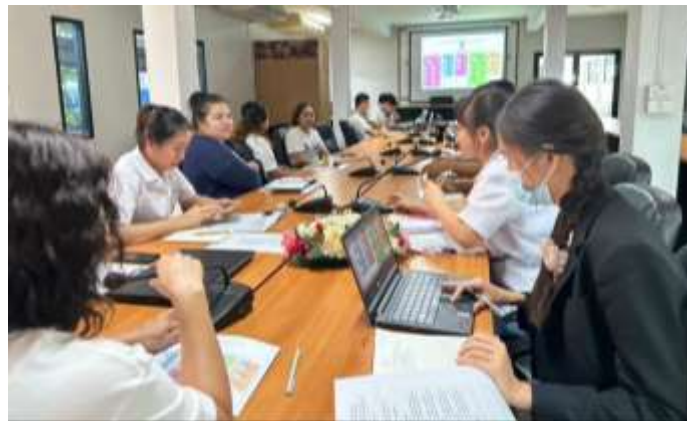
ภาพแสดงการประชุมสรุปผลการปฏิบัติงานประจำเดือนกรกฎาคม และชี้แจงแผนการปฏิบัติงาน ณ ห้องประชุมศูนย์วิจัยและพัฒนาผลิตภัณฑ์ปศุสัตว์ปทุมธานี ในวันพฤหัสบดีที่ 27 กรกฎาคม 2566 (เพื่อแลกเปลี่ยนเรียนรู้กันภายในหน่วยงาน เกี่ยวกับการปรับเปลี่ยนกระบวนการดำเนินงาน)