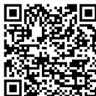
13.2 แบบลงทะเบียน ผู้ผลิต ผู้ประกอบการ OTOPTOP