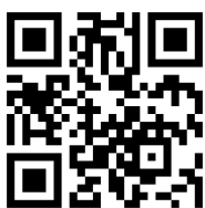
13.1 แบบฟอร์มกรอกข้อมูล พื้นฐานผลิตภัณฑ์ (OTOP)