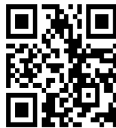
13.2 แบบประเมินการฝึกอบรมเกษตรกร