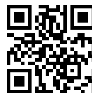
13.6 แบบประเมินการประชุมสัมมนา